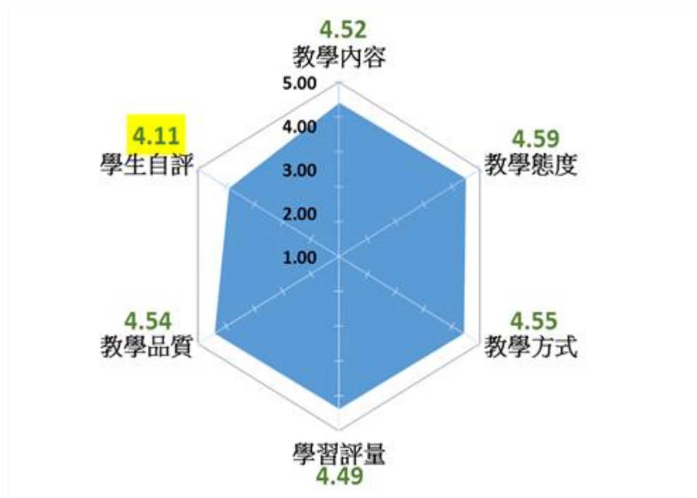
圖二、教學評量之雷達圖分析

3. 六個構面之雷達圖分析如下(圖二)，其中可看出各個構面中分數較低的是「學生自評」，故建議能多辦理相關成長活動。本班仍會積極辦理相關成長活動，以提升學生學習動機，並改善學習行為。